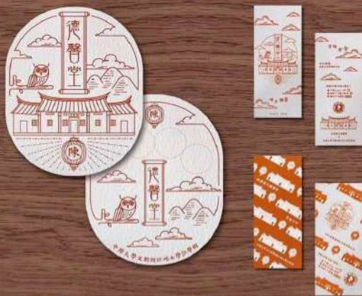
▲融合老屋造型語彙的文創商品。

人與人之間的連結是服務中最讓人印象深刻的經歷，雖然不全是美麗的相遇，但也讓學生們在服務的過程中收穫了許多人情世故，獲得難能可貴的友誼。